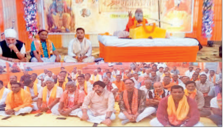
और ताली बजाने मात्र से भी अनेक शंकाओं का समाधान हो जाता है। उन्होंने कहा कि श्रीराम कथा वह दिव्य प्रवाह है, जिसके श्रवण से मन, वाणी और कर्म स्वतः पवित्र हो जाते हैं तथा जीवन में सत्गार और सद्भाव का संचार होता है।