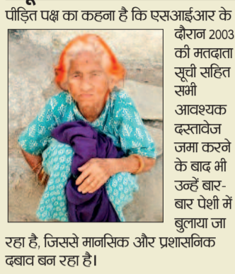
रहा है, जिससे मानसिक और प्रशासनिक दबाव बन रहा है।